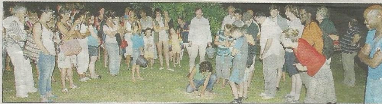
Plantation de la petite graine par le public